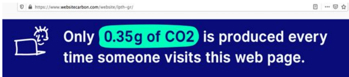
Εικόνα 4. www.websitecarbon.com

Η έρευνα επεκτάθηκε και στο μέγεθος που έχουν οι ιστοσελίδες τη πρώτη φορά που την επισκέφθηκε ο χρήστης. Υπάρχουν αρκετά εργαλεία για να μετρηθεί το μέγεθος της ιστοσελίδας, στη συγκεκριμένη εργασία χρησιμοποιήθηκε το εργαλείο Page Size Inspector, είναι επέκταση στον φυλλομετρητή Google Chrome. Οι μετρήσεις ήταν οι εξής (από το μικρότερο μέγεθος): Μουσείο Λευκού Πύργου 1MB, Εθνικό Αρχαιολογικό Μουσείο 6.3MB, Μουσείο Ακρόπολης 8.5MB, Μουσείο Ηρακλείου 9.5MB, Μουσείο Δελφών 10.1MB. Το τελευταίο μέρος της αξιολόγησης πραγματοποιήθηκε με το διαδικτυακό εργαλείο "Website Carbon Calculator" www.websitecarbon.com , το οποίο υπολογίζει την ποσότητα ηλεκτρικής ενέργειας και στη συνέχεια την μετατρέπει σ' έναν αριθμό για το CO 2 . Για την ιστοσελίδα από το Μουσείο της Ακρόπολης το εργαλείο υπολόγισε ότι παράγει 0,76g σε CO 2 κάθε φορά που κάποιος επισκέπτεται την ιστοσελίδα. 0,89g σε CO 2 κάθε φορά που κάποιος επισκέπτεται την ιστοσελίδα του Εθνικού Αρχαιολογικού Μουσείου. Η ιστοσελίδα από το Μουσείο Ηρακλείου παράγει 2,09g σε CO 2 . Η ιστοσελίδα του Λευκού Πύργου έχει την χαμηλότερη παραγωγή 0,34g σε CO 2 . Η ιστοσελίδα από το Μουσείο Δελφών παράγει 2,02g σε CO 2 .