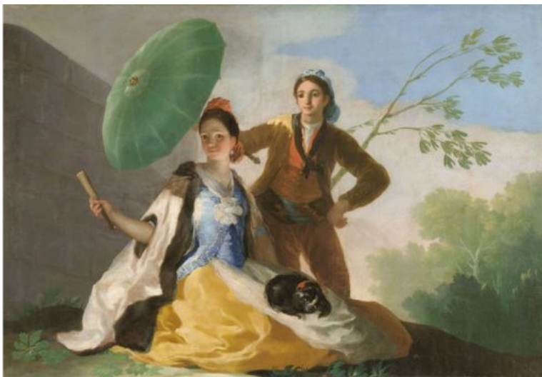
Εικόνα 1. El quitasol (The Parasol), Francisco de Goya, Prado Museo

περίπου 9,6 εκατομμύρια λίτρα νερού και 2.400 μεγαβατώρες ηλεκτρικής ενέργειας ετησίως. Εκτός από τον βιώσιμο σχεδιασμό, το περιεχόμενο του μουσείου ασχολείται κυρίως με περιβαλλοντικά ζητήματα (Museu do Amanhã, 2022). Επιπλέον, το Μουσείο Φυσικής Ιστορίας του Λονδίνου έχει δεσμευτεί να γίνει το πρώτο μουσείο στον κόσμο που θα θέσει έναν επιστημονικό στόχο να μειώσει τον άνθρακα. Αναφέρουν ότι η βιωσιμότητα είναι βασικός μοχλός στη διαδικασία λήψης αποφάσεων (Natural History Museum, 2022). Το μουσείο Muse στο Τρέντο της Ιταλίας άνοιξε το 2013 και χρησιμοποιεί τεχνολογία αιχμής για να ελαχιστοποιήσει τις επιπτώσεις του στο περιβάλλον (Museum Muse, 2022).