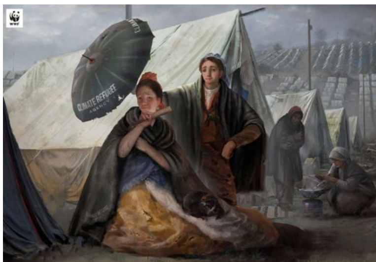
Εικόνα 2. El quitasol (The Parasol), Francisco de Goya, Prado Museo σε συνεργασία με τη WWF