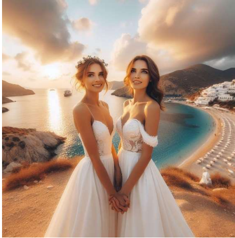
Εικόνα 1: Ιστοσελίδα: Epikos.gr | Τίτλος: Βουλή: Υπερψηφίστηκε το νομοσχέδιο για τα ομόφυλα ζευγάρια με 176 «ναι» – Τα 76 «όχι» και οι απουσίες | Πρόγραμμα: Microsoft Copilot

τίτλους μόνο στους δύο (gazetta.gr και zougla.gr) δεν έβγαλε εικόνα συναφή, στη μία περίπτωση εμφανίζεται να παντρεύεται ετερόφυλο ζευγάρι.